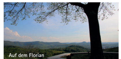
Auf dem Florian

dafür, dass der Florian nicht mit Büschen und Bäumen zuwächst — durch die Beweidung bleibt er als Aussichtspunkt dauerhaft erhalten. Auf dem Gipfelplateau des Florian (E) genießen Sie eine grandiose 360° Sicht und erfahren Interessantes über den Florian und Gustav Ströhmfeld. Eine Besonderheit ist das Arboretum (F) . Der auf kleinster Fläche befindliche botanische Garten besteht seit über 100 Jahre und ist mit seinen mehr als 140 Baumarten aus aller Welt ein exotisches Kleinod.