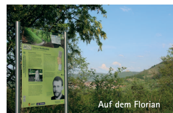
Auf dem Florian

gefördert durch Biosphärengebiet Schwäbische Alb